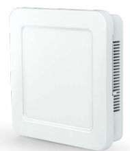
Innenblende E 28